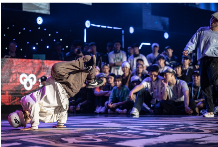
(決勝での AMI 選手の様子)